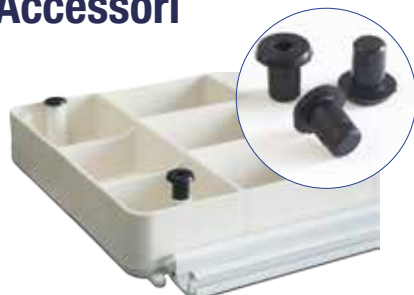
Piedini in gomma per posa su superfici porose