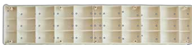
Passobeach parte inferiore