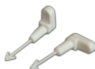
Fermagli di ricambio