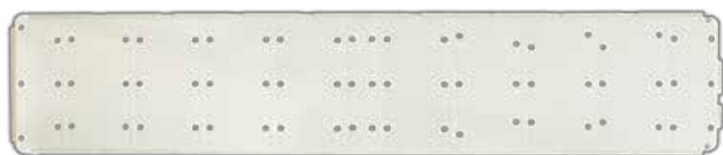
Passobeach parte superiore

Passobeach è commercializzato in cartoni da 2,5 metri lineari con doghe e congiunzioni da assemblare.