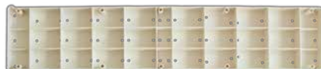
Passobeach parte inferiore