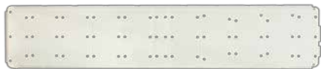
Passobeach parte superiore

Passobeach è commercializzato in cartoni da 2,5 metri lineari con doghe e congiunzioni da assemblare.