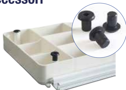
Piedini in gomma per posa su superfici porose